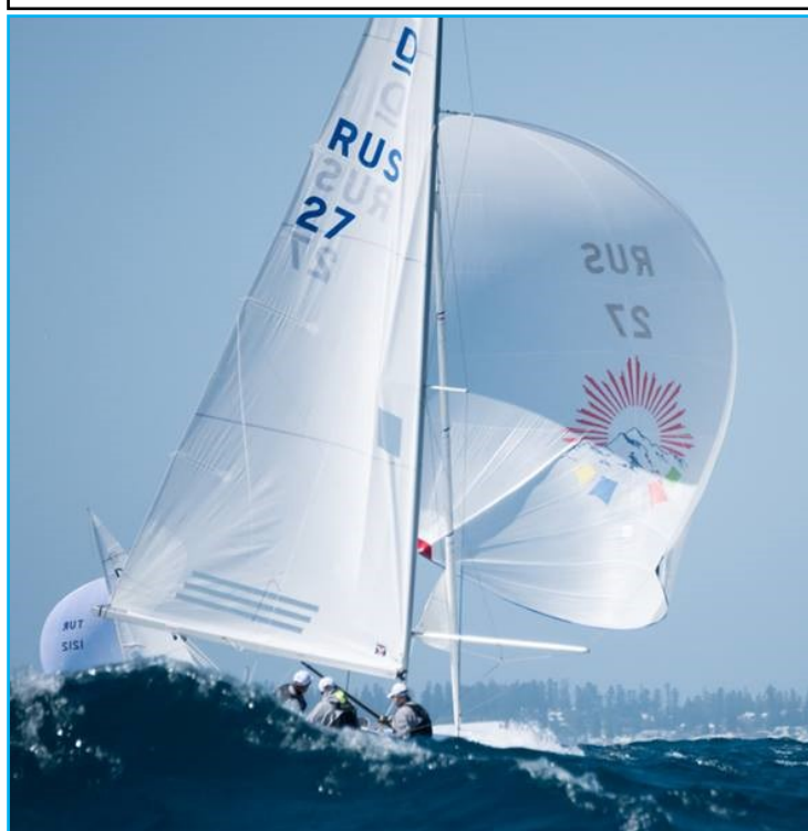
Mondial 2019, Fremantle.